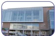
川口市行政センターや図書館が入っている建物(キューポラ)

ご興味のある方は、アイレディまたはMio オフィス 048-857-0213 までお問合せくださいませ。