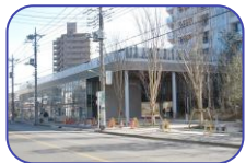
川口駅からのアプローチ