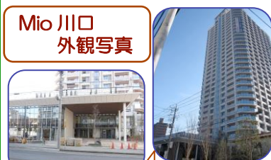
Mio 川口 外観写真

〒332-0014 埼玉県川口市金山町 12-1 サウスゲートタワー川口 2階 Mio 川口