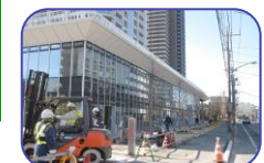
川口元郷駅からのアプローチ

マンションの低層棟の2階部分になります。1階にはコンビニ・クリニックが入ります。